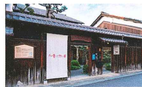
ボーダレス・アートミュージアムNO-MA