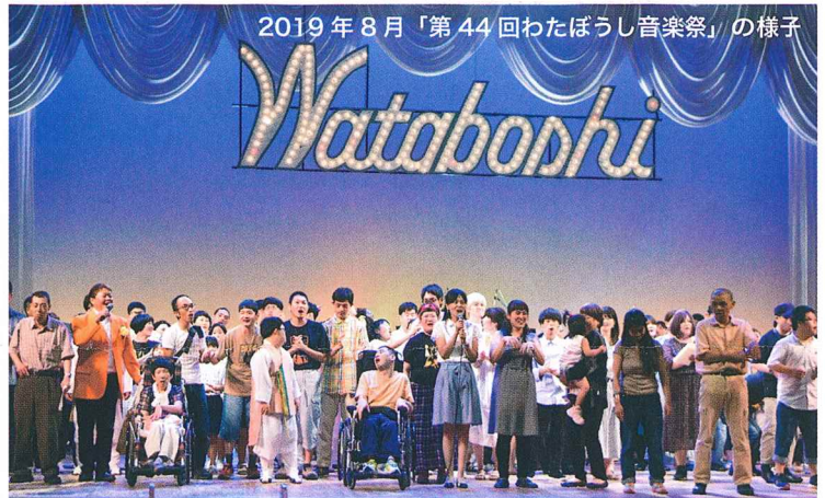
2019年8月「第44回わたぼうし音楽祭」の様子