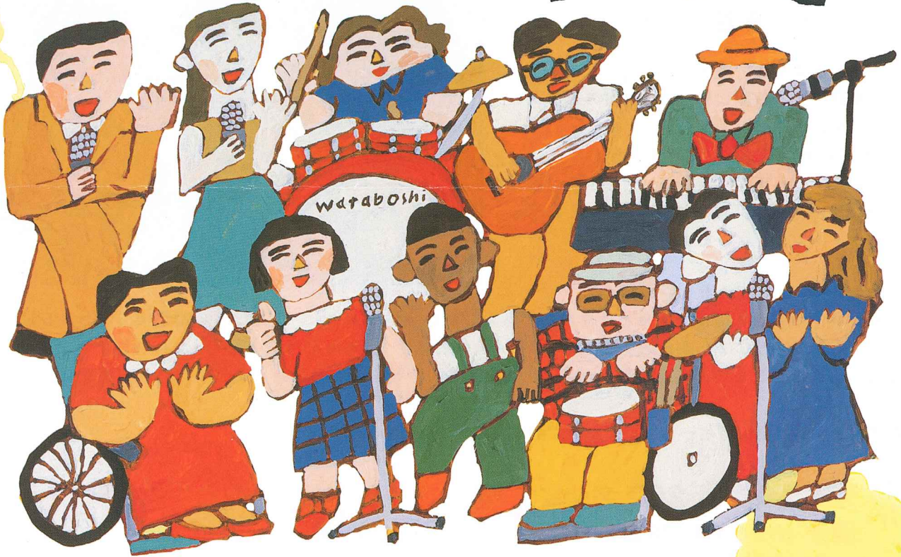
Illustration by HIRAMICHI SOTEN Title Logo by Nodoka Sumamura