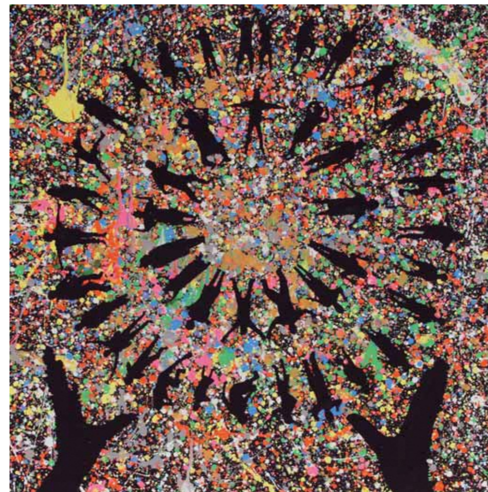
令和2年度 絵画の部 京都市長賞「ごちゃまぜ」このこのアート白川